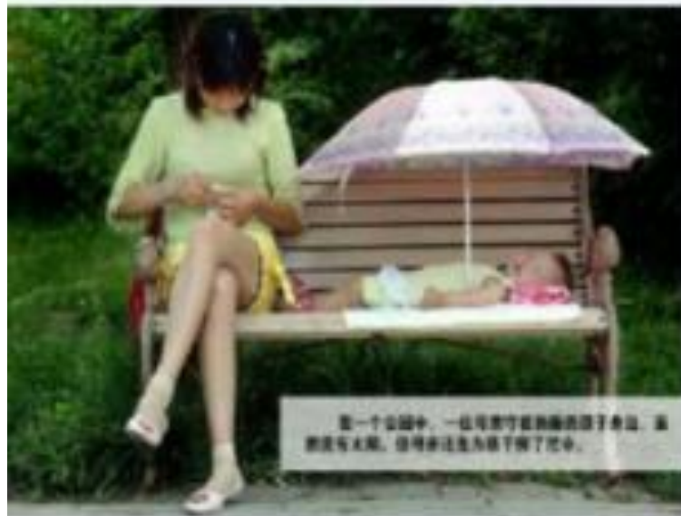
在一个公园中，一位妈妈正在给孩子玩手机，虽然孩子很累，但妈妈还在为孩子玩手机。